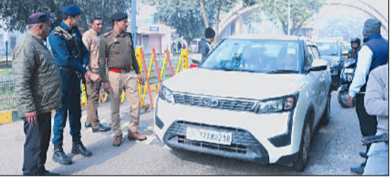
सुरक्षा कड़ी, पुलिस कमांडो तैनात