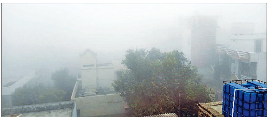
रोहतक। गुरुवार को रोहतक में छाई धुंध।

रोहतक। वीरवार को घने कोहरे की वजह से पूरा शहर धुंध की चादर में ढका नजर आया। सुबह से ही हालात ऐसे बने रहे कि आम जनजीवन प्रभावित हो गया। शहर के भीतर दृश्यता घटकर करीब 40 मीटर तक रह गई, जबकि बाहरी इलाकों में यह और कम होकर लगभग 20 मीटर तक सिमट गई। सीमित दृश्यता के कारण सड़कों पर वाहन चालकों को काफी परेशानी उठानी पड़ी और अधिकांश लोग बेहद धीमी रफ्तार से वाहन चलाने को मजबूर रहे। कोहरे का असर रेल यातायात पर भी साफ दिखाई दिया। रेलवे स्टेशन पर कई ट्रेनें अपने निर्धारित समय से देरी से पहुंचीं, जिससे