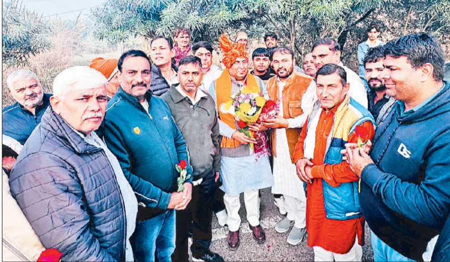
रोहतक। बहुअकबरपुर में पूर्व वित्तमंत्री कैप्टन अभिमन्यु का स्वागत करते कार्यकर्ता।