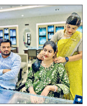
रोहतक। ग्राहक मिलन समारोह में खरीदारी करते ग्राहक।

अधिक मजबूत करना रहा। इस अवसर पर ग्राहकों के लिए विभिन्न मनोरंजक खेल, आकर्षक गतिविधियां और इंटरैक्टिव सेशंस आयोजित किए गए, जिनमें सभी आयु वर्ग के ग्राहकों ने बढ़-चढ़कर भाग लिया। पूरे स्टोर में उत्साह, खुशी और सकारात्मक ऊर्जा का माहौल बना रहा। कार्यक्रम के दौरान ग्राहकों को तनिष्क की उत्कृष्ट सेवाओं, विश्वसनीयता और नवीनतम ज्वेलरी डिजाइनों से भी रूबरू कराया गया।