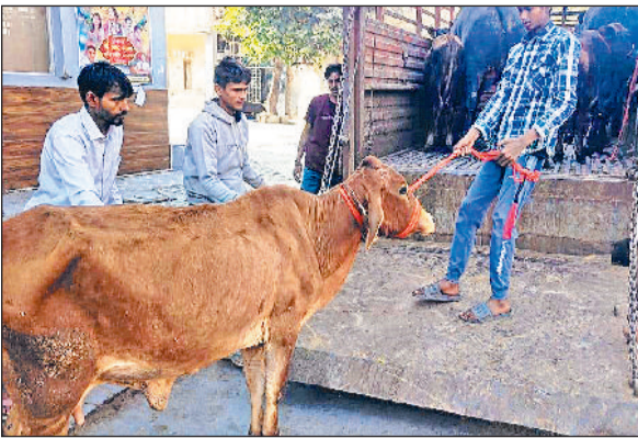
रोहतक। बेसहारा गोवंश को पकड़ते नगर निगम की टीम।

हरिभूमि न्यूज ▶▶ रोहतक शहर को आवारा गोवंश मुक्त बनाने के उद्देश्य से नगर निगम द्वारा बेसहारा गोवंश को पकड़ने का विशेष अभियान लगाता जा रही है। नगर निगम आयुक्त डॉ. आनंद कुमार शर्मा ने बताया कि निगम की टीम दिन-रात सक्रिय रहकर शहर की सड़कों और सार्वजनिक स्थानों से बेसहारा गोवंश को पकड़कर परहार स्थित नगर निगम की गोशाला में पहुंचा रही हैं। सितंबर 2025 से अब तक निगम क्षेत्र से 1200 से अधिक बेसहारा गोवंश को पकड़ा जा चुका है।